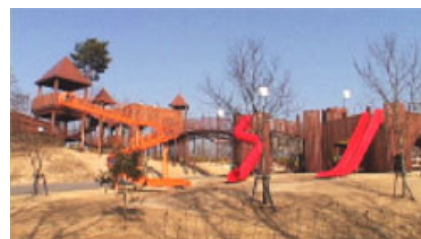
規模で人気の「レイクサイドキャッスル」