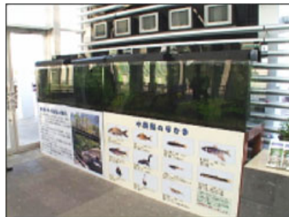
「研修館」1階の「あぜみち水族館」