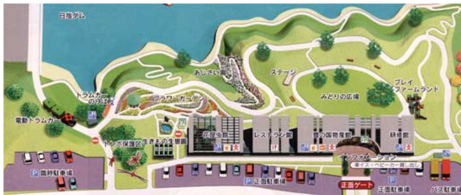
正面ゲート付近の施設レイアウト状況

ちなみに1階「ドリーム」のみ、来園のピークを迎えるゴールデンウィークと夏休み期間は、公園が閉園した後も、20時まで営業している。