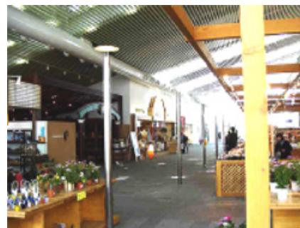
「豊の国物産館」の露天風ディスプレイ