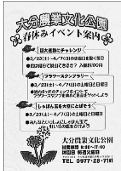
イベントで集客を徹底する

まず、大分県の農産物、公園近隣農家もしくは公園産のモノを強く押し出していないことがあげられる。他の農業