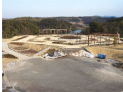
リニューアル工事中の「ハーブガーデン」

森氏の説明によると、ここは50歳代以上に人気があるという。実はここからの景観も、隠れた名所として見逃せないようだ。位置的には小高い丘で、手前の芝と木々、その先の「つり橋」と「のんびり島」、湖、遠くの「風のリズム広場」の「オランダ風車」と大型玩具が絶妙のバランスされた美しい景色となっている。リニューアルにより、西洋庭園風の「ハーブガーデン」の完成も予定されており、さらに“癒し”の空間が充実しそうである。