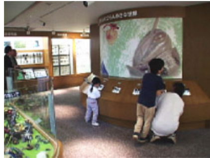
「のぞいてごらん小さな世界」これらの見せ方も先例あり