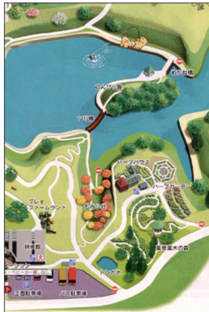
「のんびり島」～「研修館」の施設レイアウト状況