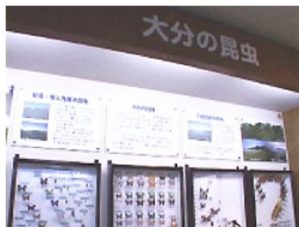
「大分の昆虫」コーナー。この切り口は一般的