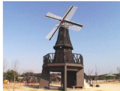
実際にオランダから寄贈された「オランダ風車」