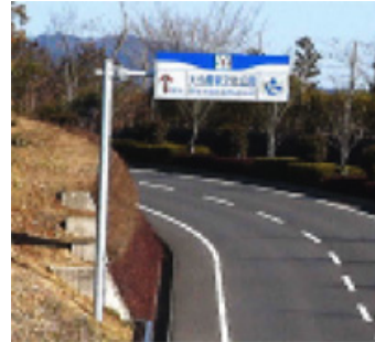
写真ではわかりにくいですが、日本一長いICの表示

また、「豊の国物産館」、「レストラン館」、「花昆虫館」はそれぞれ独立した建物だが、デッキで動線がつながれている。これらのデッキから見える景観はすばらしいビューであり、眼下にある緑の広場やフラワーガーデン、その向こうに広がる日指ダム湖の水面、そして公園を囲む