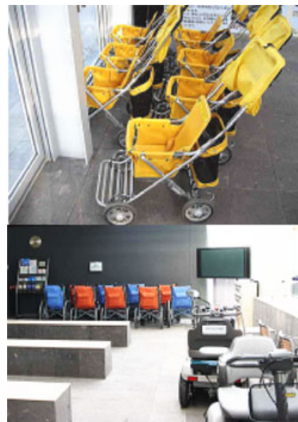
ユニバーサルデザインは先進県大分らしい