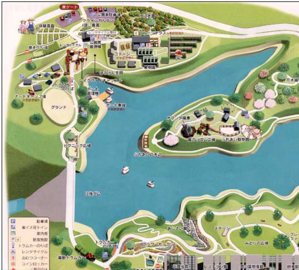
「日指ダム」から東ゲート付近の施設レイアウト状況