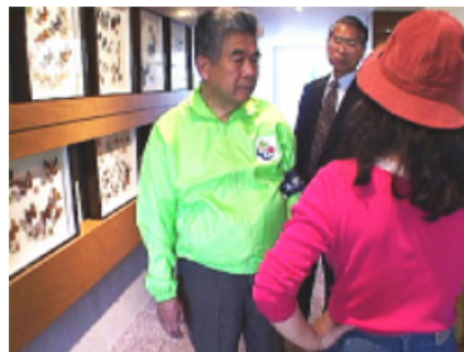
対話の後詳細説明