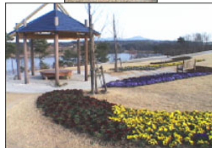
「日時計」(上)と「フラワーガーデン」の景観