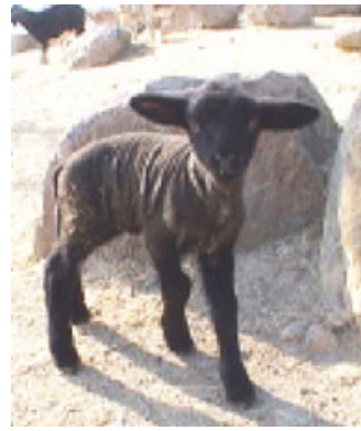
よろよろと歩く羊の赤ちゃん

ここは正面のエントランスから一番遠い場所にも過関わらず、景色の良さ+動物+たくさんの花+芝生の広場+大型遊具によって、子供連れ客のほとんどがこここまで足を運び、お弁当を広げる人気の場所になっている。