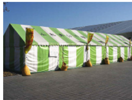
冬季は土日祝日のみ営業の「野菜直売コーナー」