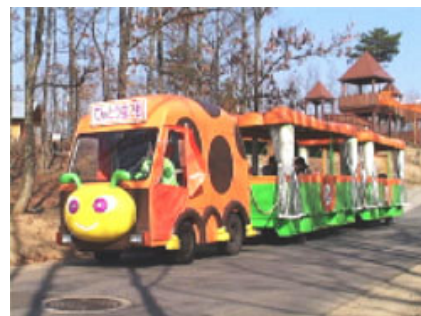
てんとう虫を模したトラムカーが大音量で走る