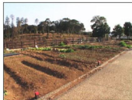
「クラインガルデン」。人気が高い