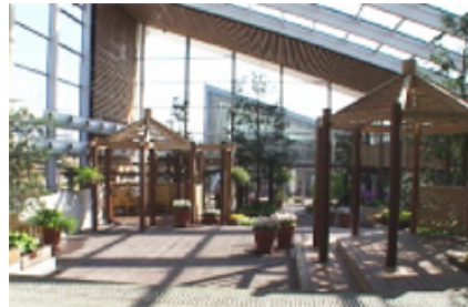
「花昆虫館」のエントランスロビー

(1)「自然環境と昆虫のすみか」では、川の上流から下流までの模型に、環境の変化とすみかをパネルで表示し、それぞれの場所で生息している昆虫を選択。