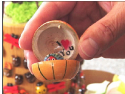
メルヘンチックないちばんのお土産