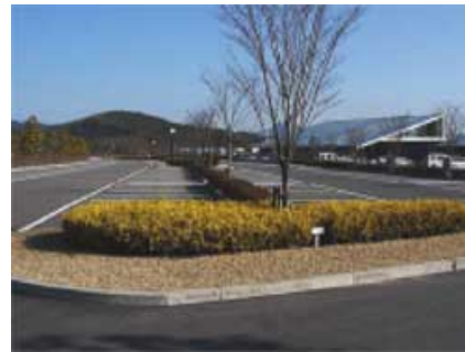
正面ゲートの左右に広がる「正面駐車場」