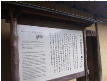
砂糖しめ小屋 (パンフレットより)