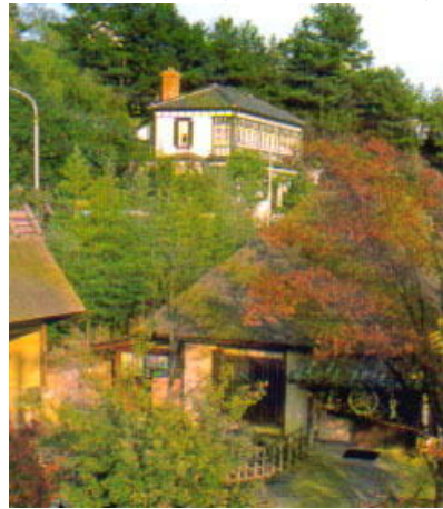
「わら家」の外観（リーフレットより）

客席の方は民芸調になっていて、天井が高く、壁や柱は濃い色に変色していて、よい意味で歴史を感じさせる。平日、それも雨の昼下がりのせいかな、3組ほどがテーブルに付いているだけで広い店内はガラガラだった。