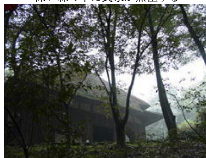
深い森の中に民家が点在する

うどん屋の店舗に古い民家を利用する、というアイデアを発想した社長の行動はそこで留まらなかった。あるとき、絵画の購入を検討されていたが、「この絵画は自分が買わなくても他の誰かが買うだろう。しかし、古い民家は自分が買わなければ、たとえ価値があるものでもいずれ朽ちてしまうだろう」と考えられた（購入を検討していた絵画と、候補に挙がっていた民家の価格がほぼ同額だったそうだ）。建造物の移築には通常かなり高額のコストがかかるものだが、うまいことに、陸運業なら自社で移築ができてコストもそれほどかからない。