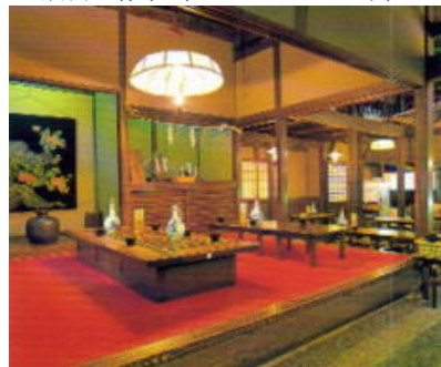
店内の様子（リーフレットより）

そこで、女性の店員さんに「あとどれくらいかかるの？」と聞いたら「もう少しお待ちくださいねー」と言うが、別に申し訳なさそうな様子もない。結局、我々も含めて4組の客、これで混雑したのでしょうか。20分ちょっとたってから（！）、やっと所望した釜揚げうどんがやってきた。つゆは、“いりこだし”が利いていてなかなか美味。麺は私には柔らかめな気がしたが、釜揚げだからこんなものなのかな？レジの脇でおみやげのうどんも売られていて、最初はおいしかったら買っていこう、と言っていたのだが、結局ここでは買わなかった。おいしかったけどうどんを食べるまでにそんな経緯が