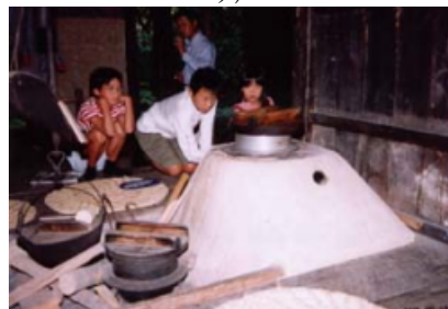
料理教室の様子

年末年始には、「しめ縄作り」、「餅つき」、「振舞酒」、「どんど焼き」など、盛りだくさんのイベントが予定されている。